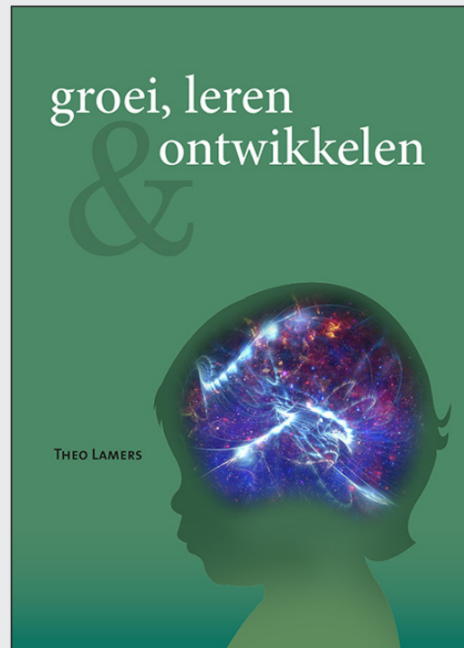
Voorblad of omslag met enkel titel, beeld en naam van de hoofdauteur.

Je zou kunnen volstaan met alleen het vermelden van de titel en het plaatsen van een foto of kleurvlak. In dit voorbeeld zie je dat met deze elementen al iets meer is gedaan.